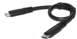
数据线 x1 使用手册 x1

我们是专业的半导体代理商 业务范围涵盖世界主要笔记本型电脑 及手机制造商 拥有迅速横跨两岸三地的广阔通路与 多元深入的技术行销支援服务 欢迎 IC 设计业者合作洽谈